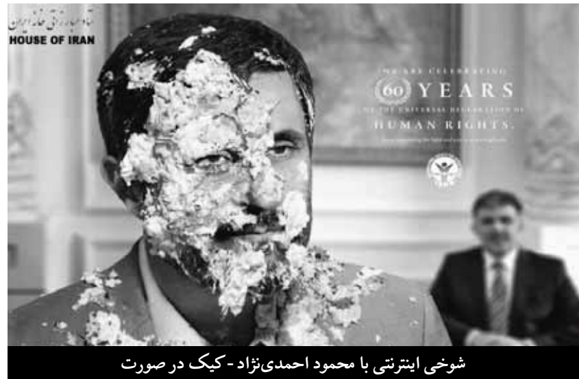
شوخی اینترنتی با محمود احمدی‌نژاد - کیک در صورت

از منظر ملی، قدرت یابی هر جناح، ایداً پاسخ‌گویی مطالبات مردم نیست ولی از پنجره منافع ملی، استکاک بی تردید این دو به نفع مردم خواهد بود. آنچه که منافع ملت، لیکن در کوتاه مدت است، اما که در دراز مدت باید طرح و برنامه استفاده از این رخنه باشد که در غیر اینصورت یا حسین می‌رود و میرحسین می‌آید، و این به معنی دست عوض کردن جناحین در دایره بسته بربریت است. برای توضیح چرایی این مطلب، نیکوتر آن است که جنبه طبقاتی درگیری این دو جناح را توضیح داده و