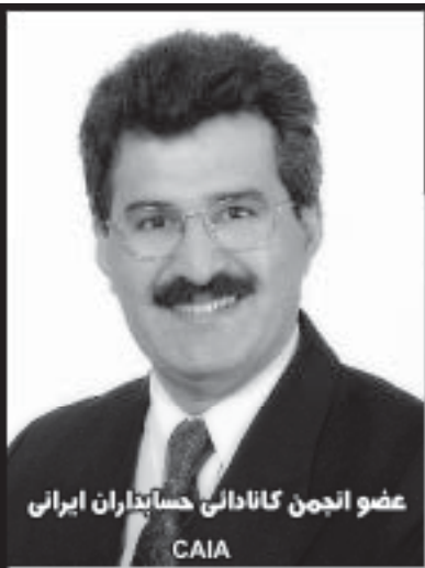
عضو انجمن کانادائی حسابداران ایرانی CAIA

با توسعه امکانات ارتباطی جدیدتر، کار تماس با